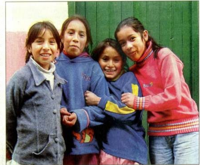
Täuschende Fröhlichkeit. Diese Kinder sind vergiftet und brauchen Hilfe.

„Zehn Mikrogramm Blei pro Deziliter Blut sind aus Sicht der Weltgesundheitsorganisation gerade noch akzeptabel“, erklärt am örtlichen Krankenhaus Neurologe Hugo Villa. „In La Oroya haben fast alle Kinder den vier- bis achtfachen Wert; sie sind chronischer Schwefeldioxid-, Ar-