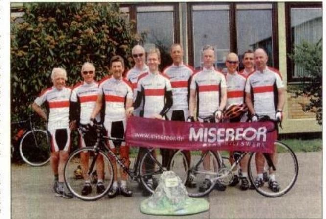
Sie nehmen die härteste Bergtour auf sich, die es für Laien gibt, die zehn Radler vom Team Misereor aus Mauer. Auf dem Rücken prangt das Logo der RNZ.

Info: Spenden für La Oroya sind jederzeit willkommen auf folgenden Konten der Gemeinde Mauer, Stichwort Misereor, 7001509 bei Volksbank Neckartal (BLZ 672 917 00) oder auf das Konto 704249 bei der Sparkasse Heidelberg (BLZ 672 500 20).