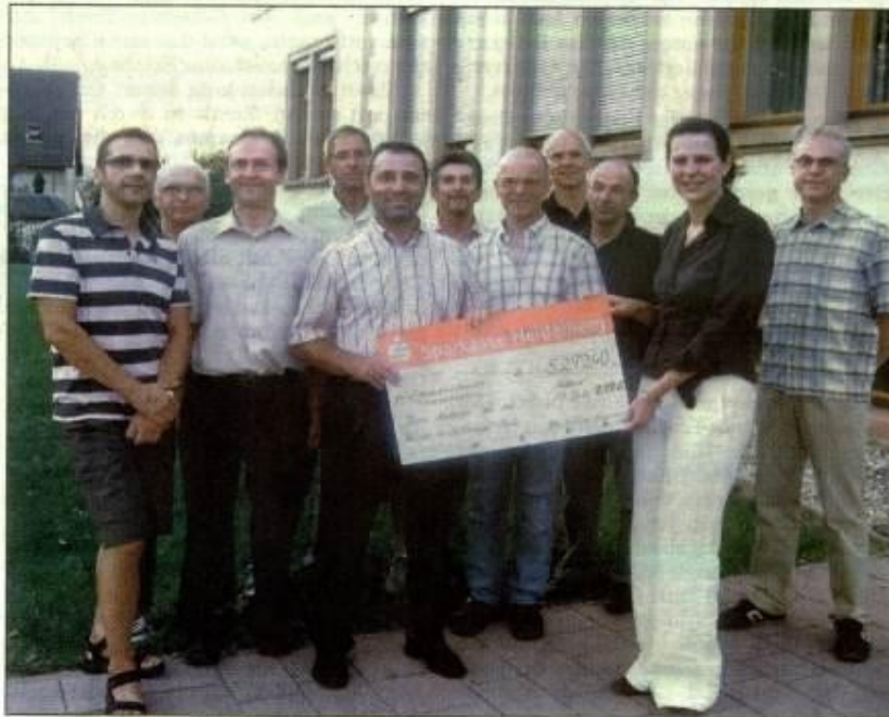
Die RNZ war immer dabei, als das „Team Misereor“ die „Tour Transalp“ meisterte, sei es als Logo auf dem Rücken der Trikots oder in der Berichterstattung über dieses schwerste Amateurrennen. Immer wurde gesammelt, jetzt gab es den ersten Scheck für Misereor.