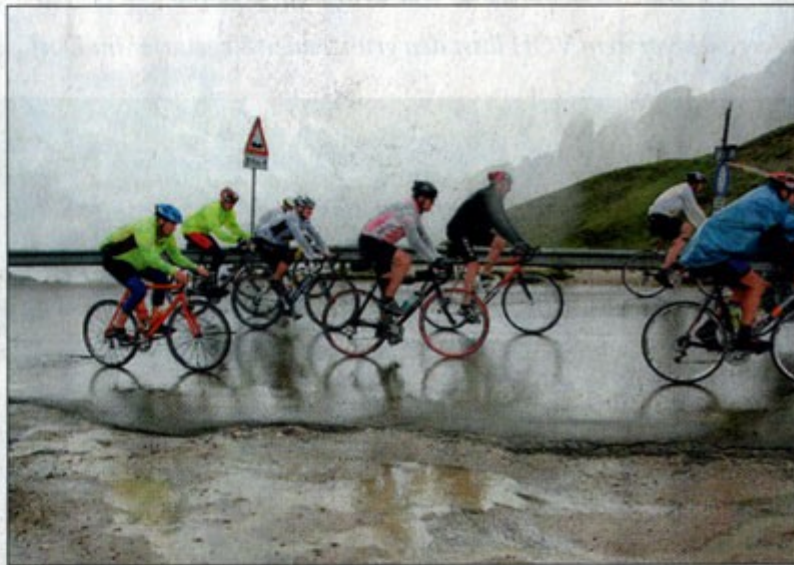
Geschafft. Das „Team Misereor“ des TV Mauer hat die „Transalp“ hinter sich gelassen und ist wieder zurück. Bleiben werden Erinnerungen sowie Bilder der Qualen und Freuden.

Dieser Samstag, indes, ist trotz allem, ein wenig Kür: Noch einmal tausend, aber höchst sanfte Höhenmeter auf den Mendelpass, anmutige norditalienische Hügellandschaft, schließlich doch noch – den dunkelblau schimmernden Gardasee vor Augen – höchster Abfahrtsgenuss;